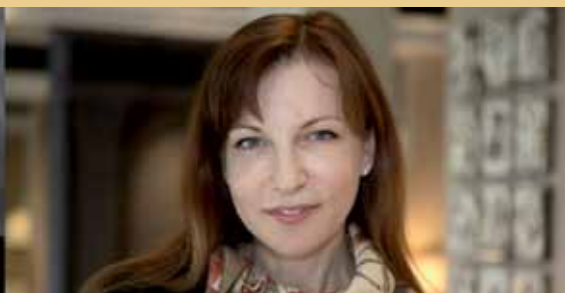
Председатель Попечительского Совета Фонда

A handwritten signature in black ink, consisting of a large, stylized initial 'А' followed by a series of loops and a long horizontal stroke.