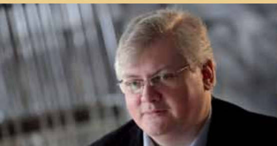
Председатель Совета Фонда

Фонд и.м. В.П. Астафьева благодарен всем, кто поддержал нашу инициативу и этот проект. Мы убеждены: обращаясь к произведениям великого сибирского писателя, мы создаем прочную основу для воспитания наших детей в духе гуманизма и любви к своей Родине.